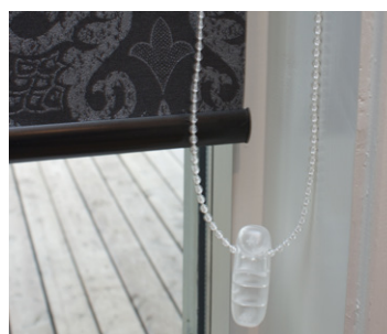
Kjedetrekk kan leveres i plast og stål