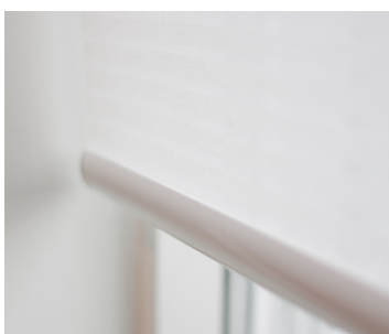
Rullegardin med hvit underlist.