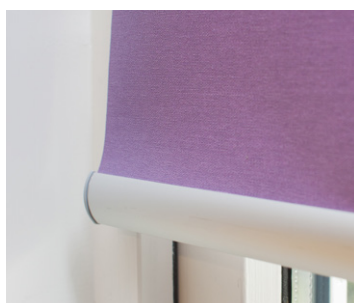
Rullegardin med sølv underlist.