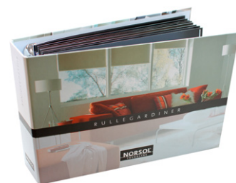
Se vår omfattende kolleksjonsperm for Rullegardiner