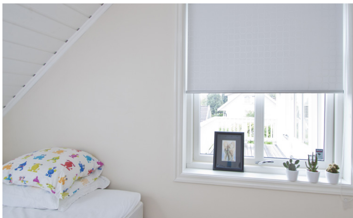
Rullegardin på soverom.